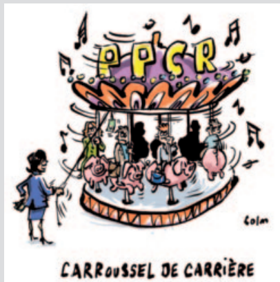
Grille des PE jusqu'au 31/08/2017

Vous trouverez ci-dessous un tableau détaillant le rythme de passage d'un échelon à l'autre ainsi que les anciennes grilles d'avancement. ■